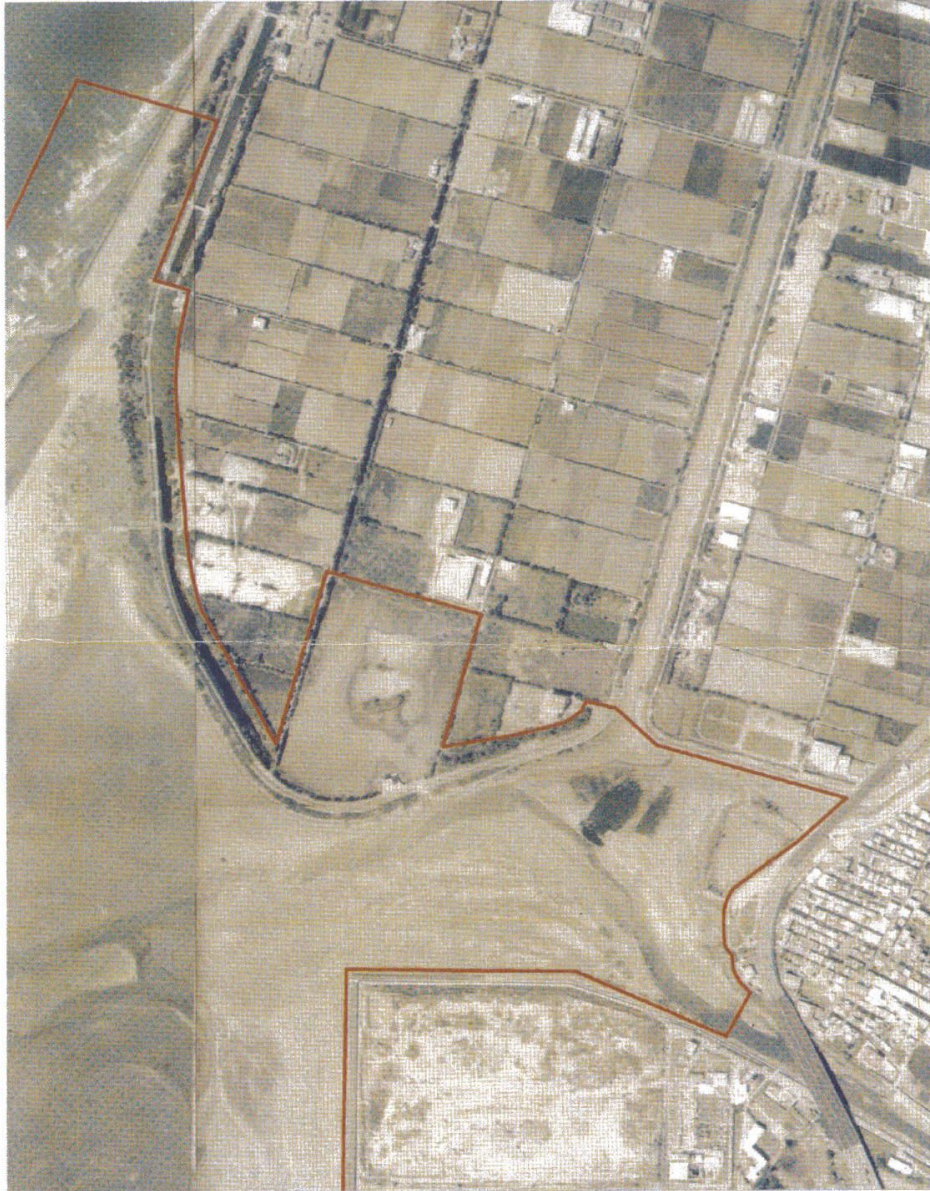
圖一之一：北界及客雅溪口