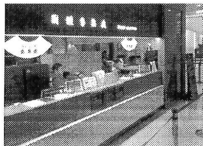
團體導覽櫃台購票處