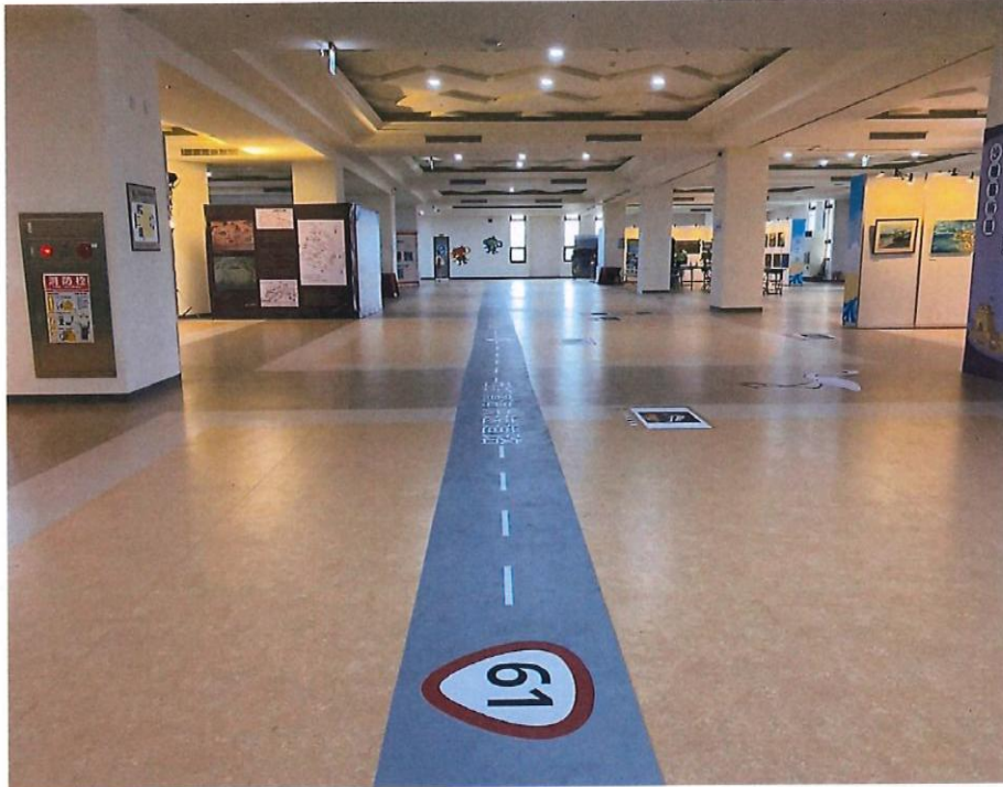
臺中市大安港媽祖文化園區現況照片(一樓餐飲區)