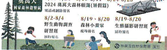
林業及自然保育署 圖說

8/2-8/4 野生動物調查研習班 預約報名 8/19-8/20 森林小畫家 現場報名 8/19-8/20 生態攝影研習班 預約報名