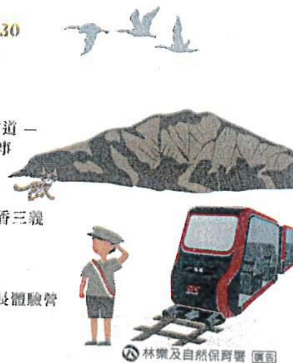
林業及自然保育署 圖說