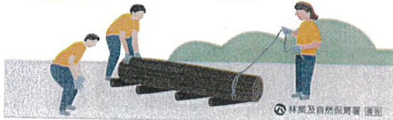
林業及自然保育署 圖說

池南 國家森林遊樂區 8/10 池南仲夏躍市集 自由參加 8/15 夜探池南-靜謐秘境 預約報名