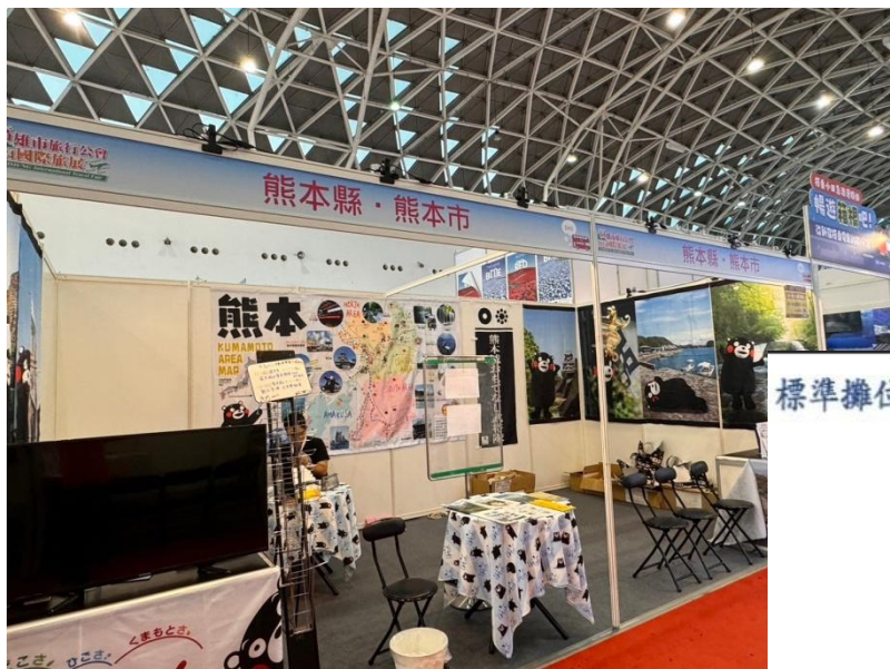
標準攤位基本配備