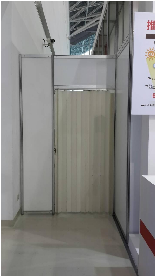
牆面通道建置 (南館12組)